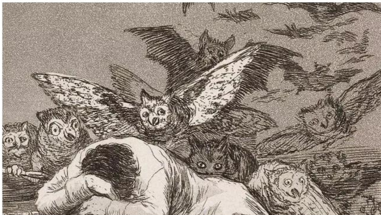
'El sueño de la razón produce monstruos', un aguafuerte de los Caprichos de Goya.

El encuentro cultural bienal tiene como objetivo promover el arte de un país y se celebrará de octubre de 2025 hasta febrero de 2026 en diferentes ciudades de Bélgica