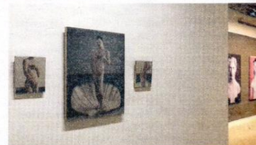
A dalt, 'Flora' (Oleg Dou, 2015). A sota, la galeria Lab 36.