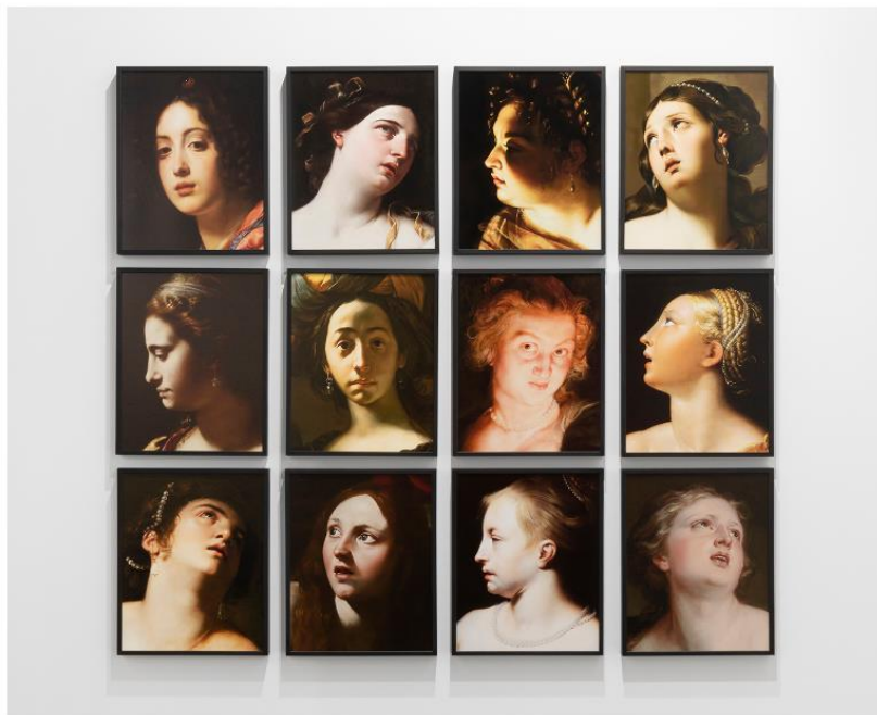
La Rabbia di Proserpina, 2022. María María Acha-Kutscher.

Se trata de 'Womankind'; 'Yesterday, Today, Tomorrow' y 'Superfcitions 1924 - 2024: The Existence Lies Somewhere Else', una exposición colectiva que conmemora 100 años de surrealismo