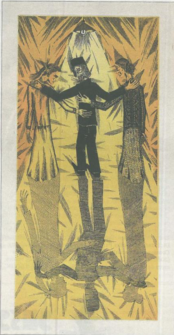
Metamorfosi Franz Kafka- Joan Ponç (1967), a la galeria Eude.

La galeria Eude es suma a l'homenatge que altres espais barcelonins fan a Joan Ponç amb aquesta exposició que recull aquarel·les i aguatinetes de la sèrie Don Quixotte (1979), i que mostren l'interès de Ponç pels personatges de Cervantes , així com aquarel·les del llibre Metamorfosi Franz Kafka- Joan Ponç (1967), entre d'altres.