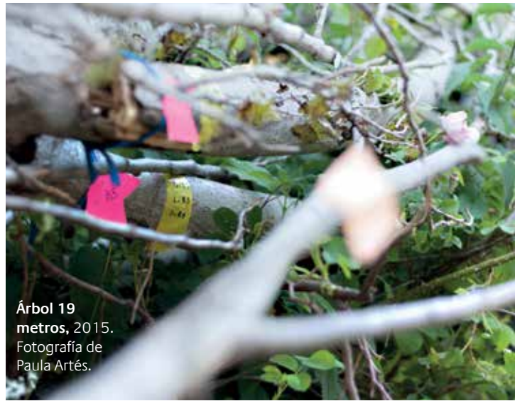
Árbol 19 metros, 2015.

Lo imperceptible para el ojo humano es foco de atracción para este creador. Matemático y doctorado en física, la instalación y el vídeo que ahora presenta nacieron al contemplar unas perfectas hileras de árboles que le llamaron la atención en un trayecto en tren de Barcelona a Girona. Resultó que esa organización espacial estaba manipulada por el ser humano, pero el crecimiento vegetal no, y aun así había respetado la composición artificial. Fue entonces cuando Vidal se cuestionó que no todo lo que nos parece por azar, lo es, y no todo lo natural carece de un sistema preciso para desarrollarse. Después emprendió este estudio con el fin de hallar una regla, un patrón de lo salvaje. Hasta el 12 de octubre. ■ SARA VALVERDE