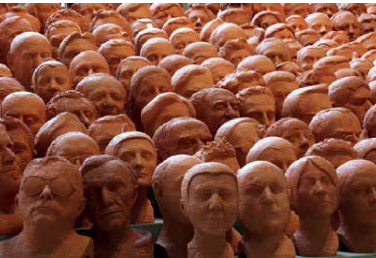
Los bustos de Torino che guarda il mare , por Luigi Mainolfi.