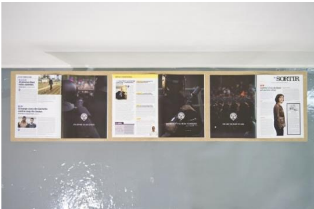
Vista de la exposición “Os protegemos de vosotros mismos”, del colectivo Democracia, en ADN Galería, Barcelona, 2014.