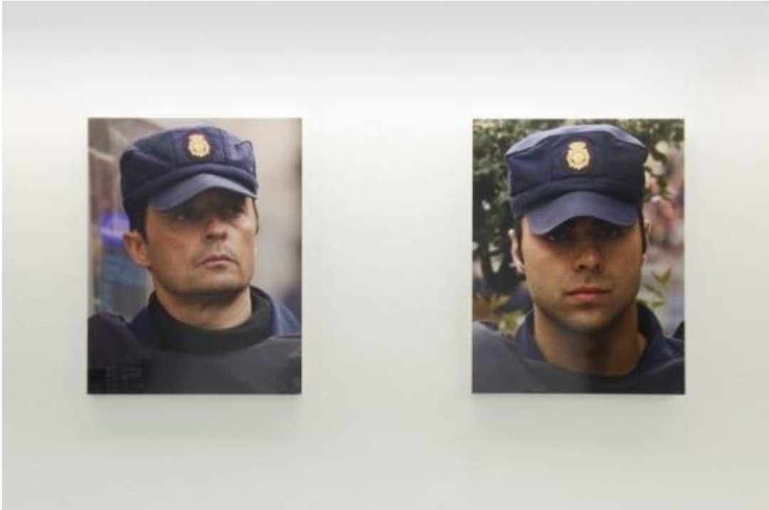
Vista de la exposición "Os protegemos de vosotros mismos", del colectivo Democracia, en ADN Galería, Barcelona, 2014.

El último trabajo, en formato audiovisual, titulado No hay espectadores , recoge las rutinas previas a un partido de fútbol en Chile. En el vídeo apreciamos a Los Panzers (ultras locales), junto con los preparativos policiales. A medida que se calientan motores y ánimos, el cuerpo policial parece hacerse cada vez más pequeño. De nuevo el dilema sobre ese rostro humanitario nos cuestiona. Ciertamente es que en determinados contextos la acción policial se presenta necesaria; también es cierto que no todos cojean del mismo pie. Pero en dicho contexto conviene preguntarse por los espectadores que faltan. El lugar que hoy ocupa el campo de fútbol fue el lugar en el que se llevaron a cabo miles de torturas durante la dictadura de Pinochet. El colectivo Democracia vuelve a ser molesto con ese pensamiento unidireccional y hunde el interrogante en radial: ¿no hay espectadores porque somos algo más?, ¿somos más bien animales? o ¿no hay espectadores porque acciones presentes y pasadas provocan acción y no queremos más expectación?