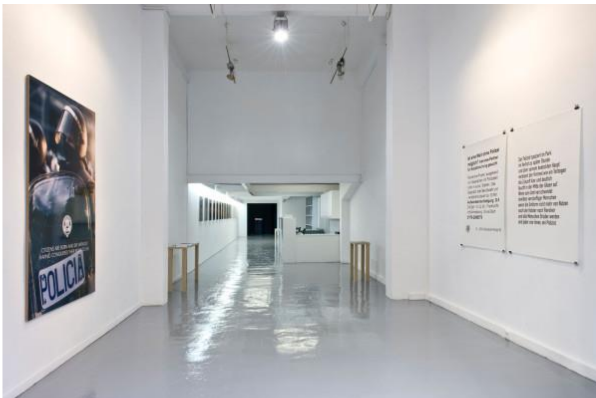
Vista de la exposición “ Os protegemos de vosotros mismos ”, del colectivo Democracia , en galería ADN, Barcelona, 2014.

La muestra presenta cuatro trabajos, todos ellos, como ya viene remarcando el colectivo desde hace tiempo, a partir de distintas manifestaciones y lenguajes que interrogan de forma directa a las estructuras de poder y a aquello con lo que se viene a definir al espectador.