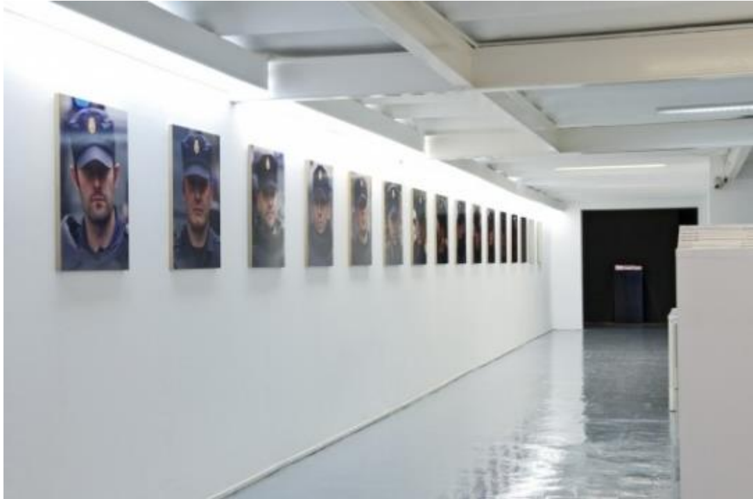
Vista de la exposición "Os protegemos de vosotros mismos", del colectivo Democracia, en ADN Galería, Barcelona, 2014.