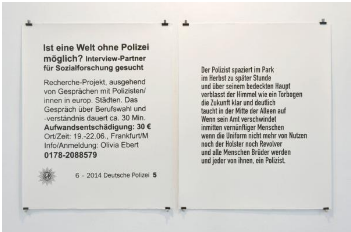
Ist eine Welt ohne Polizei möglich? (¿Es posible un mundo sin policía?), del colectivo Democracia, serigrafía. En ADN Galería, Barcelona, 2014.