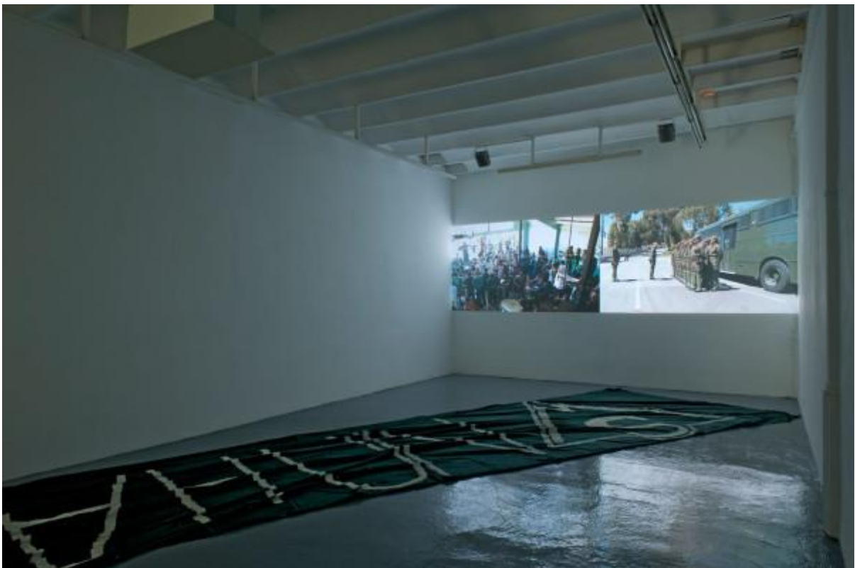
Vista de la exposición "Os protegemos de vosotros mismos", del colectivo Democracia, en ADN Galería, Barcelona, 2014.