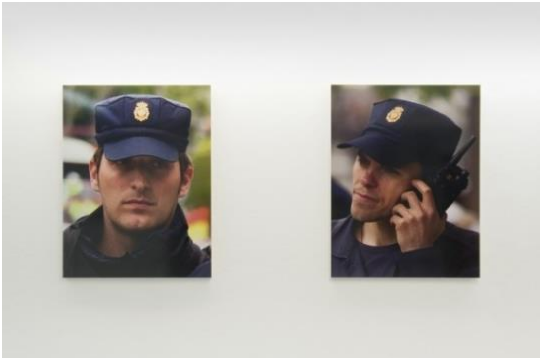
Vista de la exposición "Os protegemos de vosotros mismos", del colectivo Democracia, en ADN Galería, Barcelona, 2014.