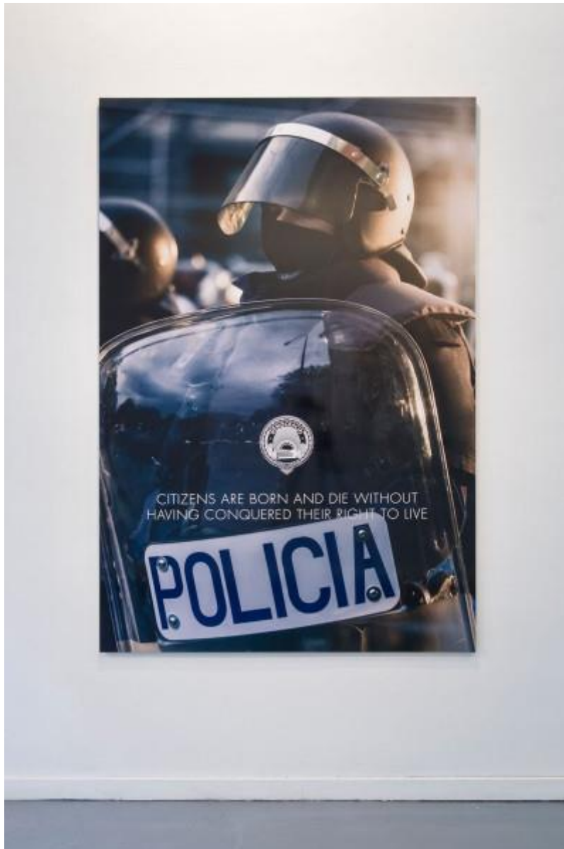
Vista de la exposición "Os protegemos de vosotros mismos", del colectivo Democracia, en ADN Galería, Barcelona, 2014.

Justo delante encontramos la imagen que ha sido utilizada para promocionar la muestra y que alude a esa posibilidad de pensar la necesidad de promocionar los cuerpos policiales bajo una mirada más humana...¿seguro?: a pesar de que el eslogan, el mismo que bautiza al proyecto, utilizado para este trabajo surge del texto de Luis Navarro publicado en el fanzine, la imagen recuerda también a esa publicidad que acompaña calles y estaciones con bellos y superficiales cuerpos. ¿Será entonces que no es más que eso?. Y el mismo slogan permite que nos preguntemos ¿a quién defienden? y ¿de quién?. Fácil es pensar en que visto el contexto en el que nos encontramos defienden al cratos de él mismo. De todo lo que éste ha generado y de las acciones y decisiones que pesan y van contra el demos .