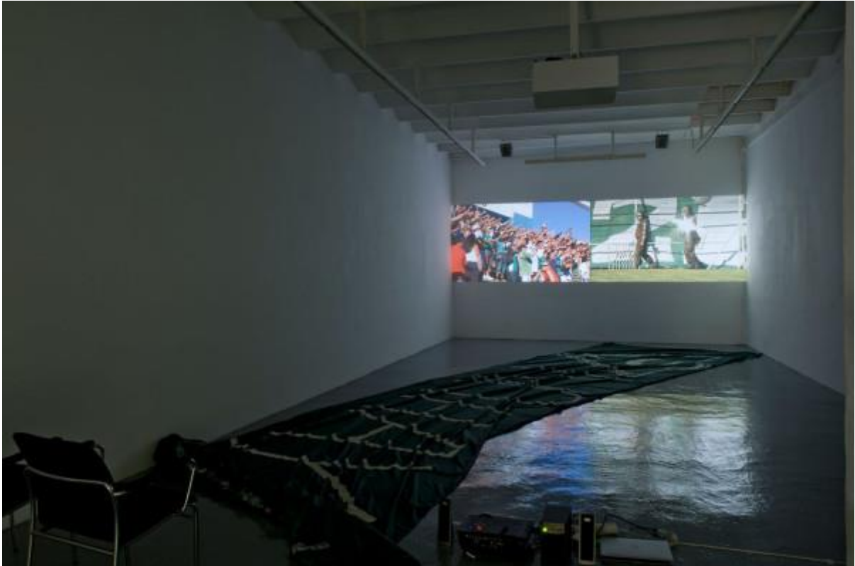
Vista de la exposición "Os protegemos de vosotros mismos", del colectivo Democracia, en ADN Galería, Barcelona, 2014.