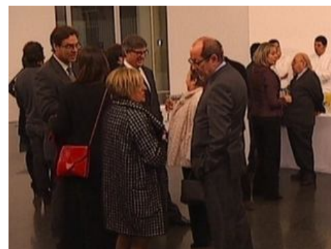
Els galeristes s'han unit al MACBA

Abans de la vetllada, els guanyadors dels premis han posat conjuntament davant de les càmeres, i després s'hi han afegit els membres del jurat que ha decidit els guardons.