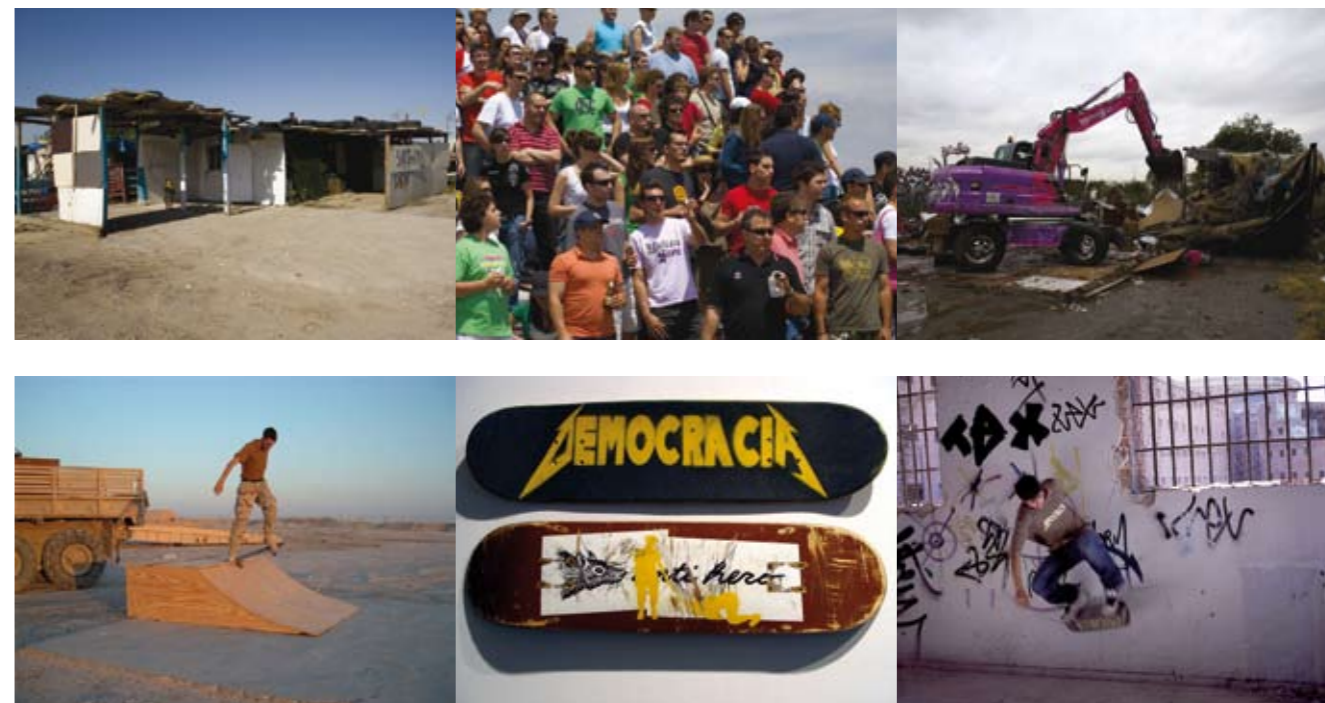
En la primera línea, y de izquierda a derecha, Smashing The Ghetto #1 –Fotografía color. Democracia, 2007. Foto: Pedro Laguna–, Smashing The Ghetto #4 –Fotografía color. Democracia, 2007. Foto: Pedro Laguna, Thorsten Rienth–, y Smashing The Ghetto #3 –Fotografía color. Democracia, 2007. Foto: Pedro Laguna, Thorsten Rienth. En la segunda línea, Skating Irak –Impresión digital. El Perro, 2005–, Skateboards Democracia –Tablas de skate con stencil. El Perro, 2005–, y Skating Carabanchel –Fotograma video monocanal. El Perro, 2005. Foto: Luis Cárcamo. Bajo estas líneas, Victima –Escultura en oro instalada en el hall del Parlamento Vasco. Democracia, 2008. Foto: Ximo Michavila.

El resultado final de la colaboración con el Sr. Rojo ha sido el videoclip del tema “Papá firma despidos” para el que hemos usado las imágenes del video Welfare State donde se muestra la destrucción de un poblado de chabolas