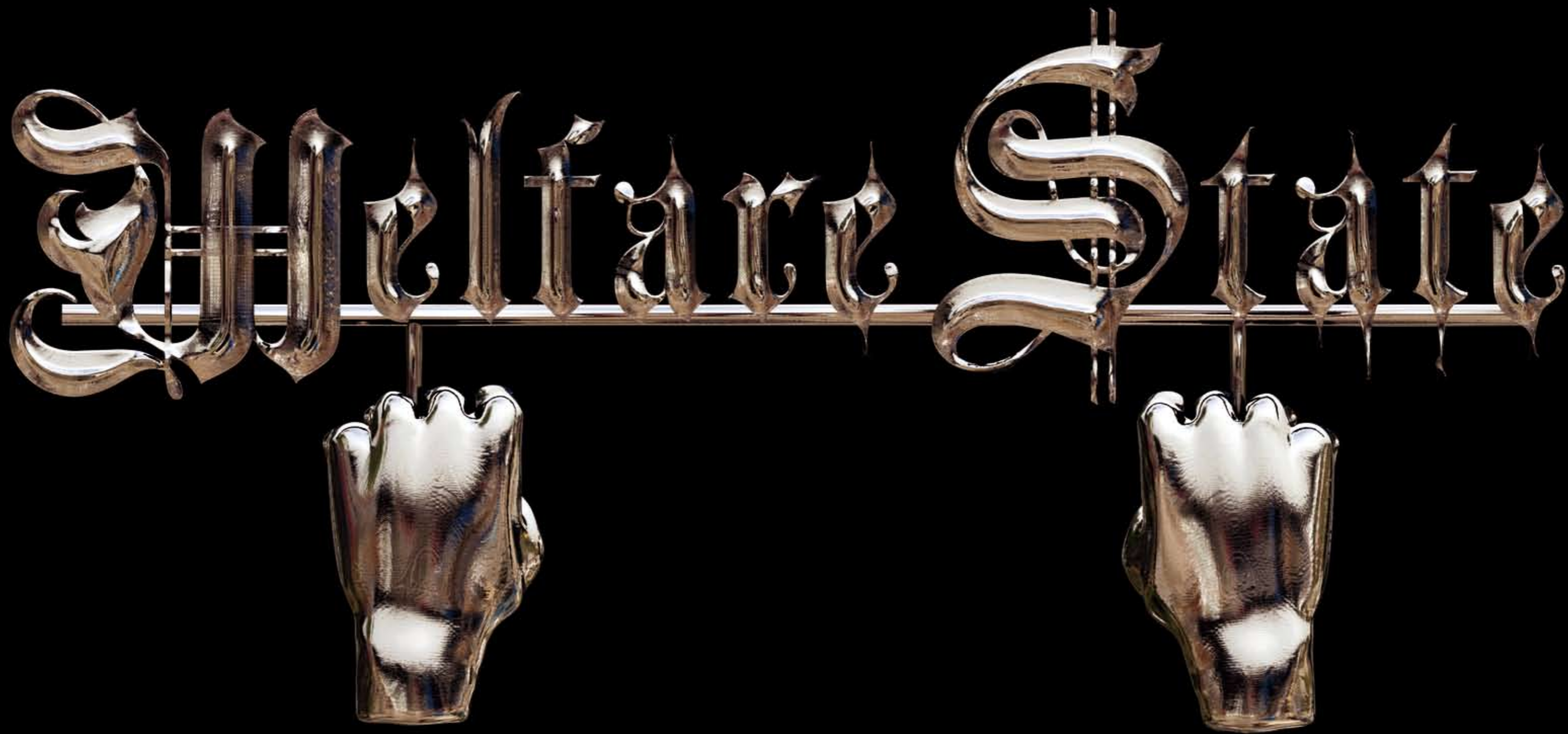
· Welfare State Logo - Fotografía color. Democracia, 2008. 3D model: Sergio García, Miguel González Vine.