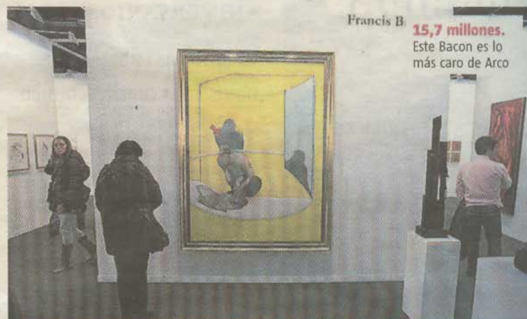
Francis B. 15,7 millones. Este Bacon es lo más caro de Arco