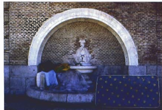
VIEJOS ESPACIOS, NUEVOS USOS 'SALA FREUD' (ARRIBA), 'DAYDREAM' (A LA DERECHA) Y 'ARQUITECTURA V'.

un sentido crítico y político, casi de denuncia.