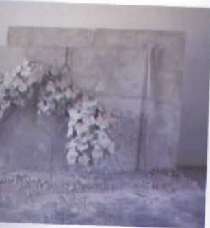
s, 2006-07. Escayola, autorrelieve,