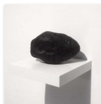
Llorenç Ugas y el paisaje que no fue