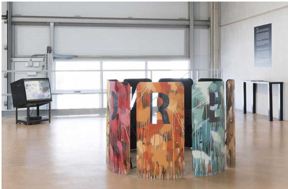
Vista de la exposición "Action Painting" en ADN Platform, 2019.

El poder difusor de Internet, subyacente en el mensaje de no pocos trabajos de Sala, ha ocasionado que algunas imágenes y vídeos de sus escudos sepultados por pintura se hayan convertido en iconos del combate del arte y de la cultura contra todo aquello que se oponga a la libertad de pensamiento, desde fuera o desde dentro de la Red, entendida esta por Avelino como zona de conflicto enmarcada en cada uno de nuestros dispositivos, identificados, controlados y censurados. No hay intimidad posible en las pantallas, el aparato que a todos nos convierte en el Truman del show. El reto es, y de ahí la estética de estas obras, camuflarnos, fundirnos en un todo orgánico, encontrar caminos para la oposición ingeniosa y la ocultación.