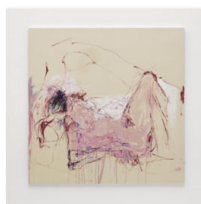
Tracey Emin: estupor y temblores