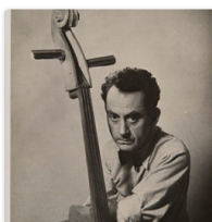
Man Ray y los objetos de su afecto