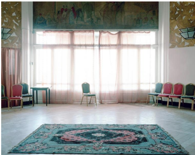
Hôtel El Safir, Ex-Aletti, Algiers City Center (2015) Residència de la delegació del Partit Black Panther durant l'any 1969 Festival Panafricà d'Argel Impressió digital 100cm x 125cm

Foreign Office combina fragments en els quals el "muntatge", la oralitat, la traducció i la poesia suggereixen una historiografia alternativa de les utopies que reflexionen sobre possibles gestos de resistència per a l'actualitat i potencialment per el futur.