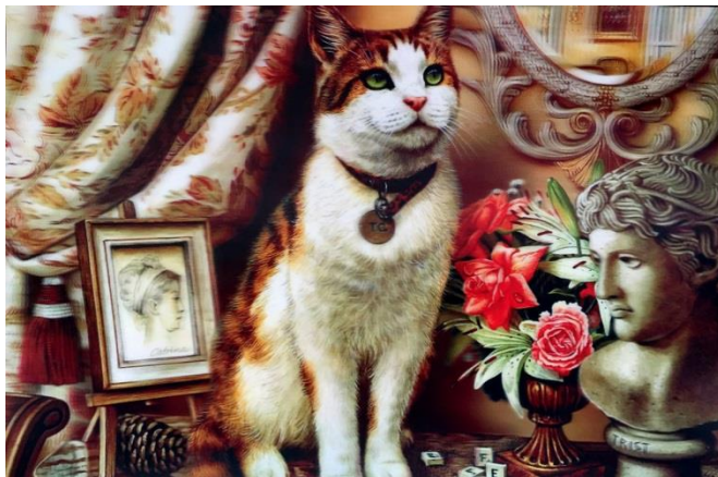
Carlos Pazos, ...y yo ¿qué coño pinto? (detalle), 2012