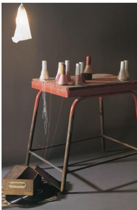
Carlos Pazos, Como una rata zurcía canciones de amor en el desván , 2002

El 3 de gener de 1970 vaig inaugurar la meva primera exposició en un lloc d'aquells als quals la gent anava de passeig i, de passada, a veure art. Va ser a la sala d'exposicions de l'Ateneu barceloní. Acabava de fer vint anys. Si l'edat no m'impedeix sumar o restar correctament, porto en aquest merder 50 anys i els que vaig caminar de quatre grapes. I a el dir això em refereixo a un parell d'anys durant els quals vaig compaginar els meus estudis d'arquitectura amb la dedicació a el dibuix, la fotografia, el collage i el cinema. Medi a les fosques i encobert, ple d'inquietud i desassossec, però a el mateix temps, amb gran intensitat en el lliurament, en un intent vacil·lant de trobar un equilibri impossible. Vaig haver de optar per prendre una decisió dràstica.