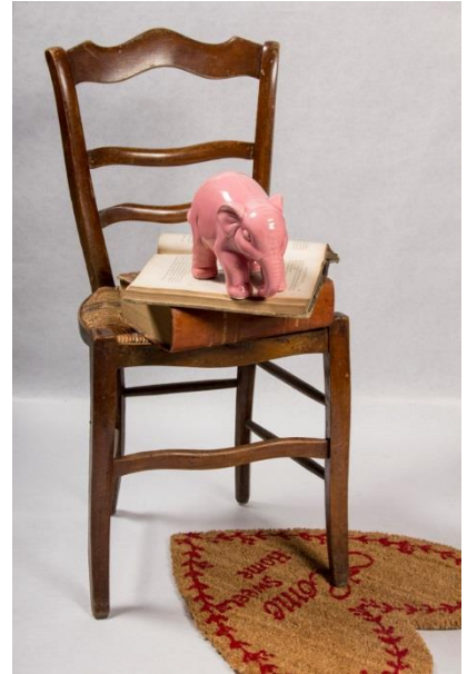
Huyendo de mí mismo hacia una muerte súbita (2015). Cortesía del artista

Aquesta pel·lícula, que fou projectada per primera vegada en el Museu Nacional Centro de Arte Reina Sofía (MNCARS) de Madrid el passat octubre del 2015, reprèn una de les facetes menys conegudes i explorades de Pazos: la de cineasta. L'artista, que va invertir 3 anys de treball intens i obsessiu per a realitzar el film, reuneix fragments seleccionats d'entre més de 1.800 pel·lícules – des de grans produccions americanes a cine d'autor, de terror o sèrie B, i des de finals del s. XIX fins a films actuals - que plantegen els clixés i estereotips al voltant del concepte d'artista i la trivialitat de l'art manejat per les indústries culturals, creant, a partir d'ells, el seu particular collage sobre el que per a ell encara existeix a la imaginació col·lectiva: un gran collage de l'univers de les arts plàstiques i literàries.