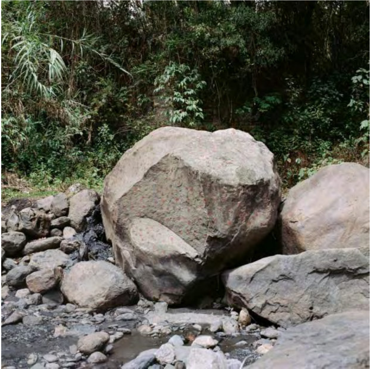
Dándole peso a los besos