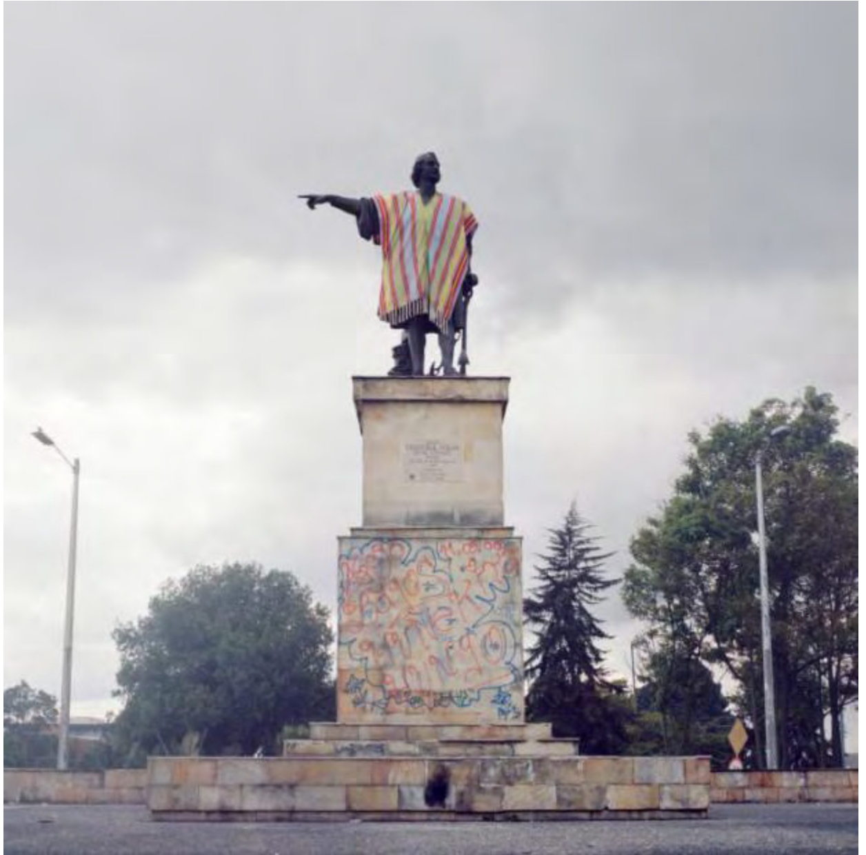
Turistes (Isabel lliurant un contracte i Cristóbal assenyalant cap al sud )