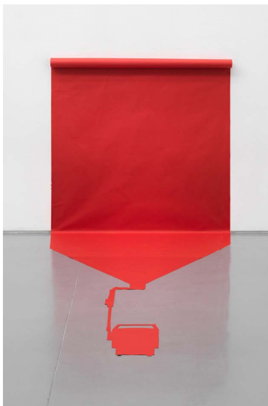
Lezioni 5 , 2011. Impressió lambda sobre dibond, 80 x 100 cm