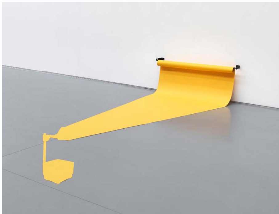
Lezioni 1 2011. Impressió lambda sobre dibond, 80 x 100 cm