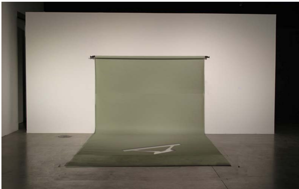
New India , 2012. instal·lació