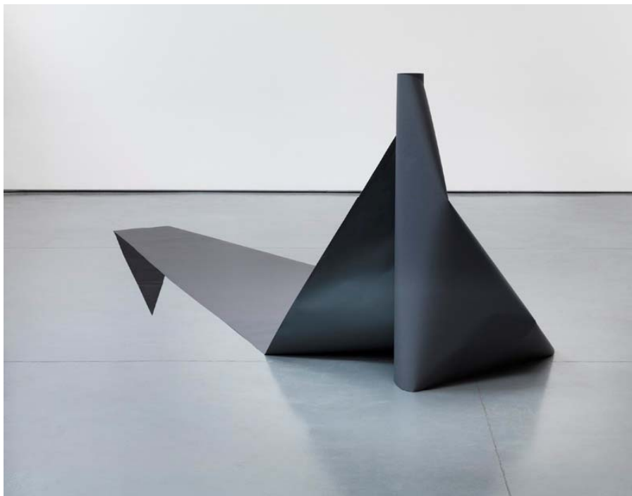
Right Construction 1 , 2011. Impressió lambda sobre dibond, 90 x 120 cm