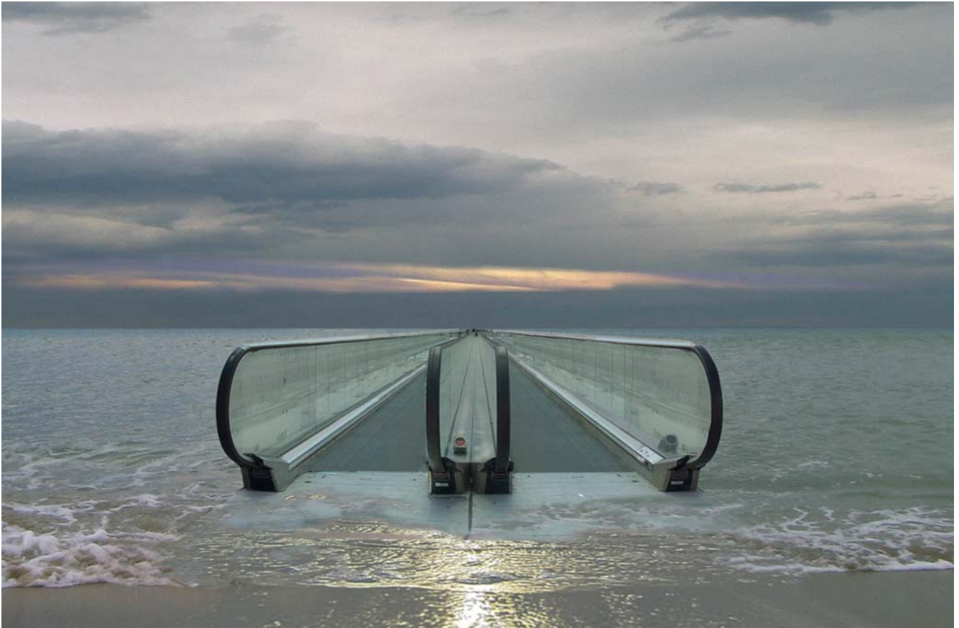
Protected Zone - Sea, 2008

En la sèrie "Se Vende" Chus García-Fraile proposa imatges d'edificis que transiten confusament algun lloc entre la pintura i la imatge digital, entre el real i el virtual. La realitat en aquestes imatges està representada pel seu mateix títol, el preu que té cada una d'aquests habitatges en el mercat. La virtualitat és l'efecte que produeix la pròpia alteració de la imatge. La degradació de la imatge del realisme pictòric a la imatge digital, reduïda al seu mínim component que és el píxel, fa adonar del procés de fragmentació de la nostra societat. Amb aquesta bipolaritat tècnica García-Fraile posa de relleu la contraposició entre la necessitat real d'un habitatge i l'obsessiva i insaciable ansietat de possessió, més pròpia d'un món de ficció. Mentre les restes d'il·lusió en la nostra cultura són molt escassos, la realitat es torna irreal, regida per uns valors inflacionaris fins l'exageració, deformats i estèticament convertits en icones de la postmodernitat.