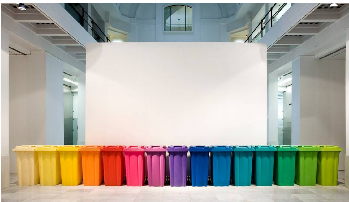
Sin título, 2008

ADN Galería, c/ Enric Granados 49, Barcelona