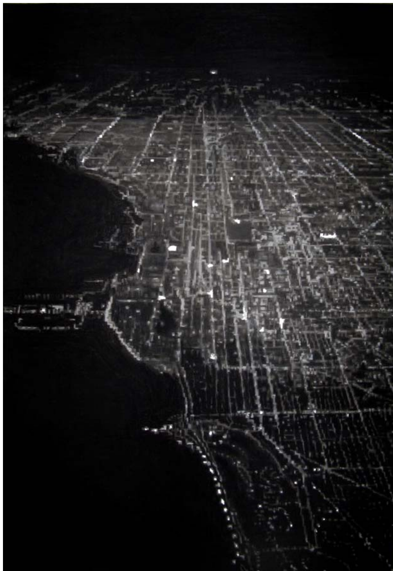
Megalópolis 2, 2008

Si su trabajo empezaba tratando el detalle para sugerir un todo, analizando pequeños objetos resultado de la actividad de una sociedad de consumo como son zapatillas o envases desechables, en esta muestra su enfoque se dilata hasta lo macro, abarcando la gran ciudad como registro máximo de la sociedad contemporánea, como contenedor y generador de las dinámicas sociales propuestas.