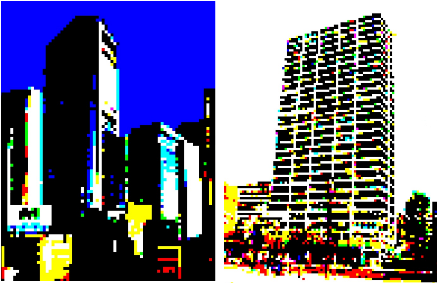
Serie "Se vende", 2006

El mateix contrast es posa de manifest en "Metròpolis" que tot i que sembla una fotografia vella en blanc i negre és un dibuix de carbonet sobre paper. De nou s'evidencia la relació entre realisme i ficció, jugant l'artista el paper de mag, capaç de decidir sobre la natura del que ens envolta i enganyar a l'espectador, fent-li veure com a verdader allò que no és més que producte de la imaginació.